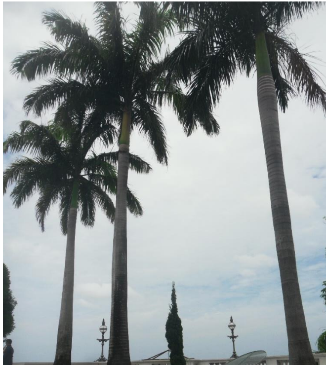
Figura 4 - Palmeiras imperiais do jardim interno do Palácio e kaizuca ao fundo

Madagascar no continente africano, com exceção da palmeira imperial (Figura 4) que tem origem nas Antilhas. Há um certo distanciamento do projeto de Burle Marx, que buscava valorizar e aplicar espécies pertencentes à flora local, mas há também espécies que permaneceram no jardins como é o caso das palmeiras imperiais, anteriores a Burle Marx