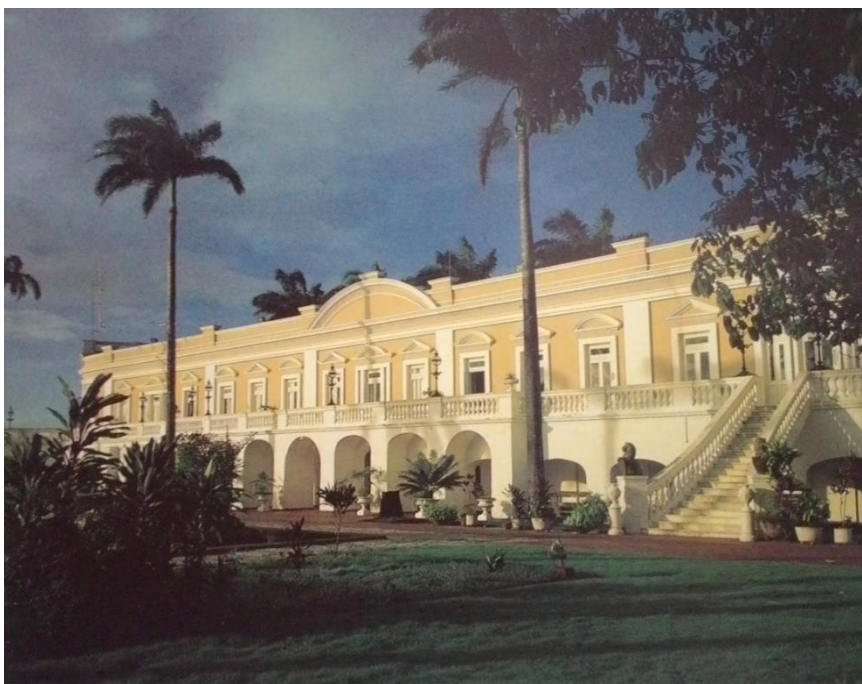
Foto: Luiz Braga (in Catálogo do Palácio dos Leões para a Companhia Souza Cruz Indústria e Comércio), 1988.

Uma das alterações mais marcantes do conjunto, diz respeito à retirada de espécies vegetais para a criação de novos caminhos destinados ao passeio e acesso de veículos. Percebe-se claramente a descaracterização da massa vegetal no entorno dos tanques, com a inserção de calçamento executado com o objetivo de permitir a passagem de veículos. (Figura 3)